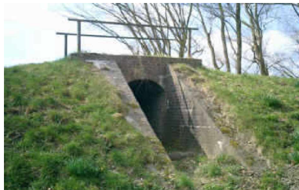
Lorendeichlücke einer ehemaligen Ziegelei an der Oste