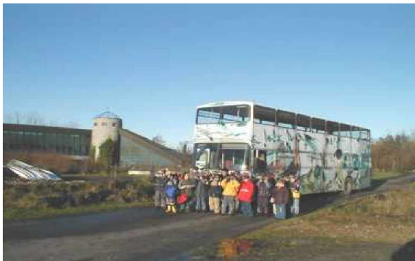
Vogelkieker-Bus vor dem Natureum Niederelbe