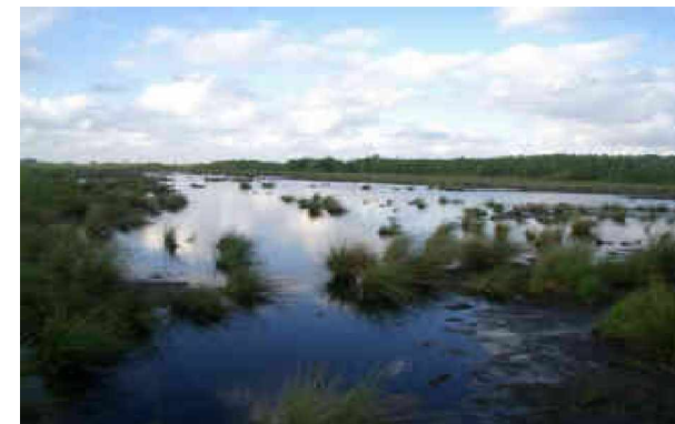
Moor an der Oste