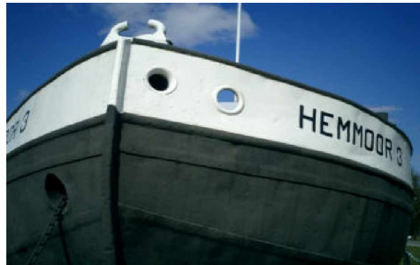
Deutsches Zementmuseum in Hemmoor