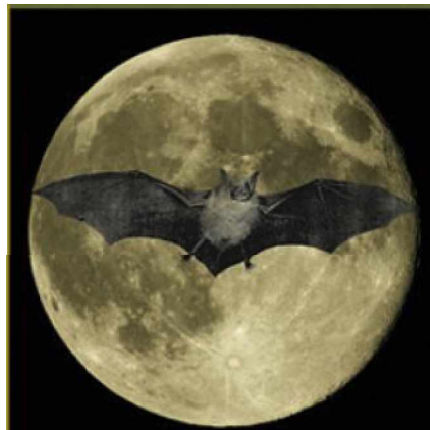
Buchtitel „Mausohrnächte“ (Ausschnitt)

Das Leben im norddeutschen Klosterthal plätschert beschaulich dahin – sieht man einmal vom Lärm der Bundesstraße ab. Als der Biologe Robert Zerg den Auftrag erhält, die Fledermäuse im Vorfeld der Planung einer Umgehungsstraße zu untersuchen, ändert sich das.