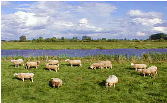
Schafe auf dem Ostedeich bei Himmelpforten

Das Krimiland Kehdingen-Oste hat viele Freunde – und das nicht nur, weil es in den Regionalkrimis so schaurig-schön und gruselig daher kommt. Die Menschen sind gastfreundlich , die Natur zwischen Moor und Meer ist großartig , die stille, von Ebbe und Flut bewegte Oste ebenso wie Kehdingen mit dem reichen maritimen Erbe.