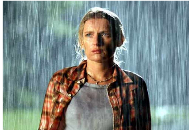
„Tatort“-Star Maria Furtwängler in Großenwörden/Oste

Kein Wunder, dass hier an der „German Crime-novel Route“ („Travel-Tipps“) über 200 Krimis und Krimi-Drehbücher geschrieben worden sind und so manche Szene für den TV- Tatort gedreht worden ist.