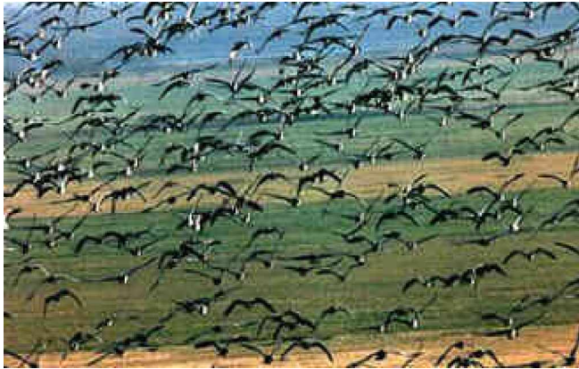
Zugvögel an der Unterelbe im Kehdinger Land