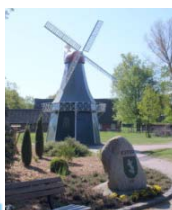
Dorfplatz in Estorf

zwei Dörfer an der Oste feiern ihren 900. Geburtstag und präsentieren sich historisch, ohne dabei veraltet zu sein.