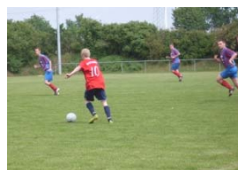
Fußball FC Oste/Oldendorf