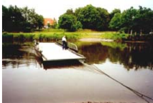
Prahmfähre in Gräpel