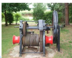
Winde einer früheren Werft in Gräpel