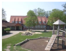
Schule in Estorf