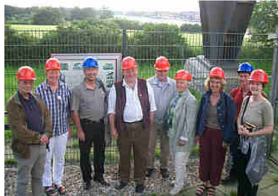
Delegation an der Hochbrücke Rendsburg

zumindest an einigen Tagen die Deutsche Fährstraße Bremervörde - Kiel nicht nur per Auto, Rad oder Sportboot, sondern auch an Bord fahrplanmäßig verkehrender Fahrgastschiffe kennenlernen.