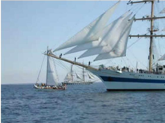
Großsegler nimmt Kurs auf Cuxhaven

Die in Osten/Hemmoor ansässige Arbeitsgemeinschaft Osteland e.V., das Lenkungsmitglied der Deutschen Fährstraße, wirbt vom 15. bis 18. August mit einem Info-Stand beim "Tall Ships' Race" in Cuxhaven für die jüngste deutsche Ferienstraße. Die AG Osteland wird mit mehreren Vorstandsmitgliedern im Pagodenzelt von Schleswig-Holstein zu finden sein.