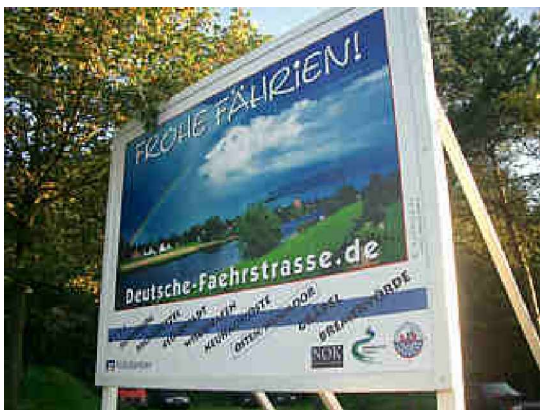
Werbetafel in Hechthausen

Die AG Osteland hat eine Serie von Großplakaten entwickelt, die mit dem Slogan „Frohe Fährrien!“, der Web-Adresse http://www.deutsche.faehrstrasse.de und mit verschiedenen Fähr- und Brückenmotiven für die jüngste deutsche Ferienstraße werben.