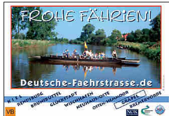
Entwurf für Werbetafel mit Gräpel-Motiv

gemeinde Nordkehdingen ordern. Inzwischen liegen auch Entwürfe mit Motiven aus Rendsburg, Glückstadt, Gräpel und Neuhaus vor.