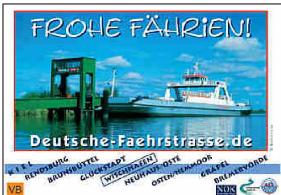
Entwurf für Werbetafel mit Glückstadt-Motiv

Die AG Osteland hat eine Serie von Großplakaten entwickelt, die mit dem Slogan „Frohe Fährrien!“, der Web-Adresse http://www.deutsche.faehrstrasse.de und mit verschiedenen Fähr- und Brückenmotiven für die jüngste deutsche Ferienstraße werben.